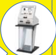
キャッシュレス 投票機